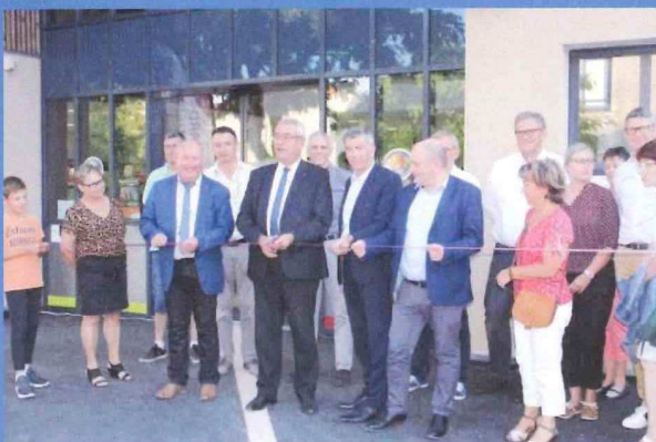
Inauguration du nouveau commerce alimentaire - 20 septembre