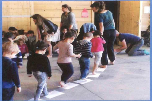
Livres en Fête - Quartier ancienne église 22 - 25 mai 2019