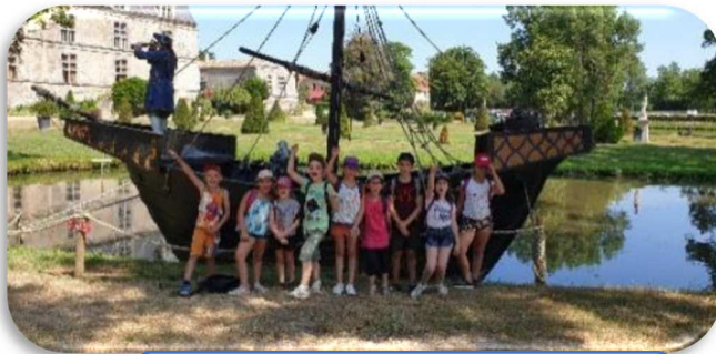
Château des Aventuriers