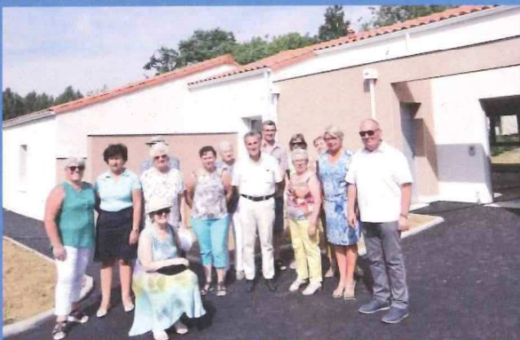
Remise des clés aux locataires des MAD - Pré de la Fontaine - juillet