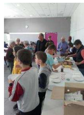
Passeport du civisme avec les CM2