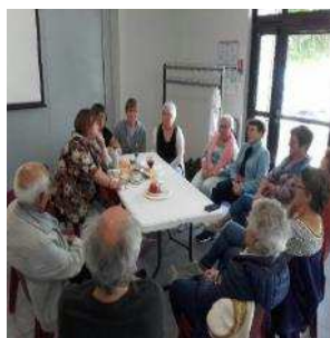
Journée infos alimentation et sport