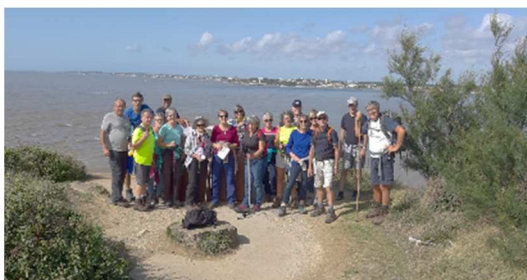
Sortie Marche à Mescher