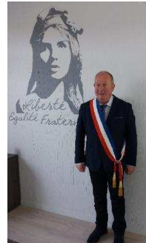
M le Maire devant la Marianne dans la salle du conseil municipal

Je vous souhaite à chacun personnellement et à nous tous collectivement une très bonne et heureuse année 2020. Que chacun puisse s'épanouir librement, dans le respect des autres, de nos institutions, de notre cadre de vie.