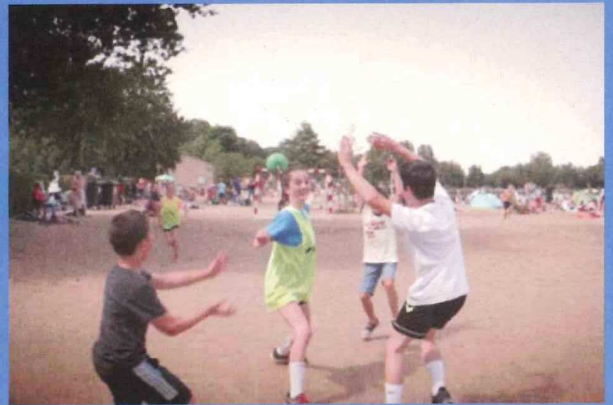
Animation Sandball - La Tricherie juillet