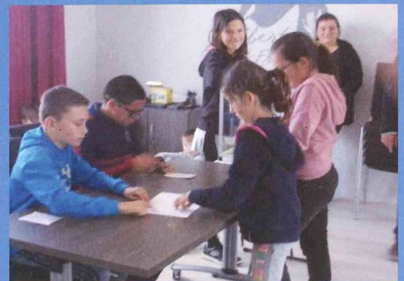
Election du nouveau Conseil Municipal des Enfants - 15 octobre