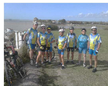
Sortie VAE à Mescher