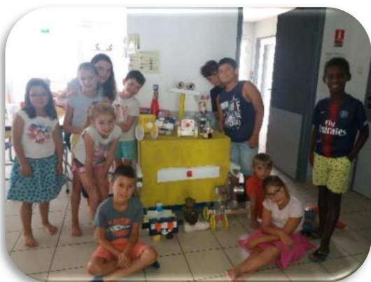
Construction de Wally