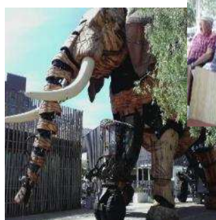
Voyage avec Vendrennes