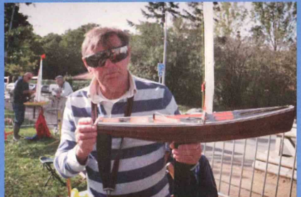
Régate voiliers RG 65 et Footy La Tricherie- 5 et 6 octobre