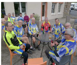
Sortie cyclos Le Longeron