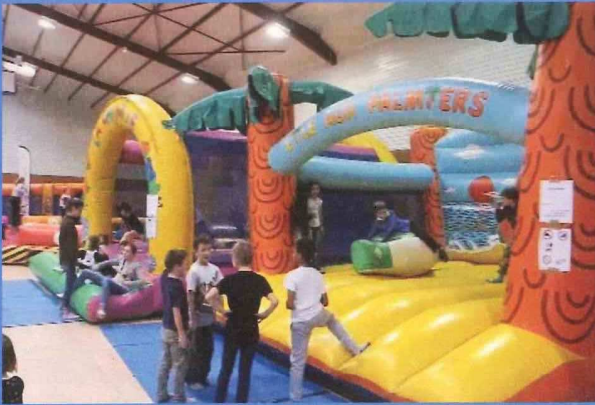
Week-end structures gonflables 9 et 10 février