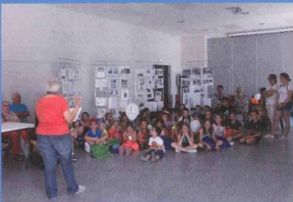
Chasse au trésor organisée par le CME 2018-2019 - 4 juillet