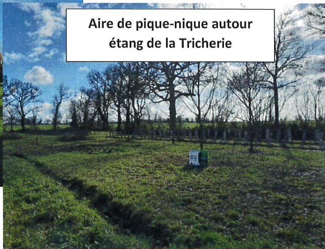
Aire de pique-nique autour étang de la Tricherie