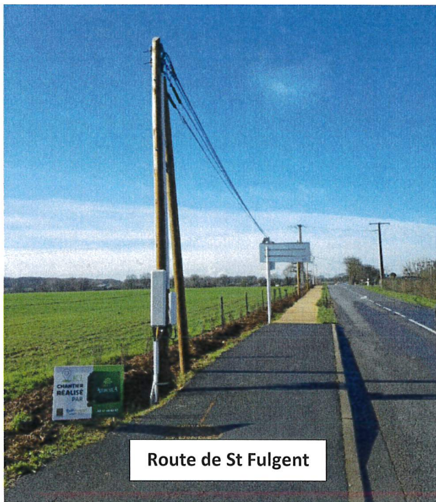
Route de St Fulgent

La commune de Mesnard la Barotière a signé une convention avec le Conseil Départemental dans le cadre du Plan Vendée Biodiversité et Climat. Cette action consiste à confier au Département la réalisation de plantations d'arbres et leur entretien pendant les 2 premières années. Ce projet est entièrement financé par le Département.